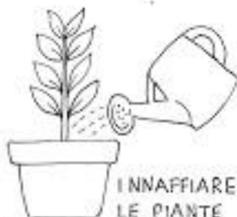
INNAFFIARE LE PIANTE