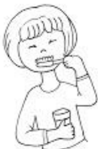
LAVARE I DENTI